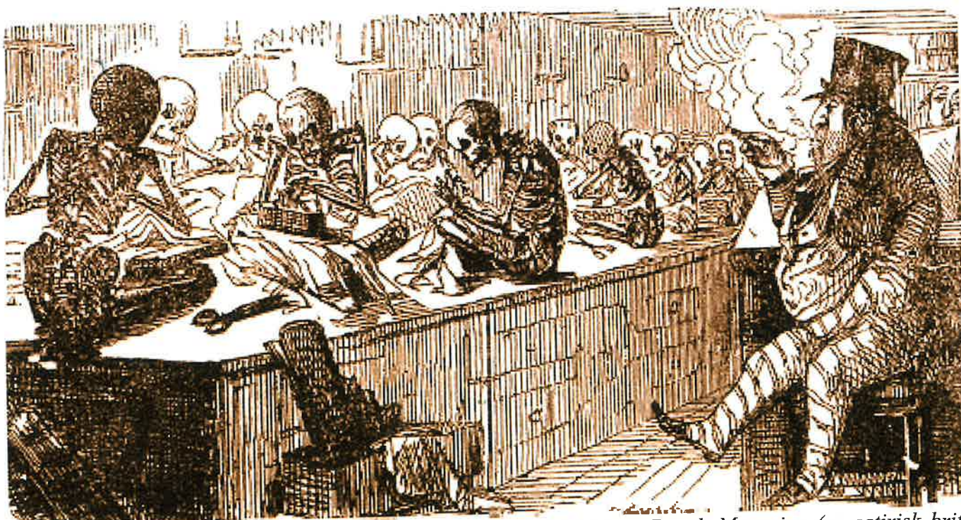
BILD 1: Denna karikatyr av tecknaren John Leech publicerades i Punch Magazine (en satirisk brittisk veckotidskrift) 1845. Bildtexten till denna karikatyr är: Billiga kläder.