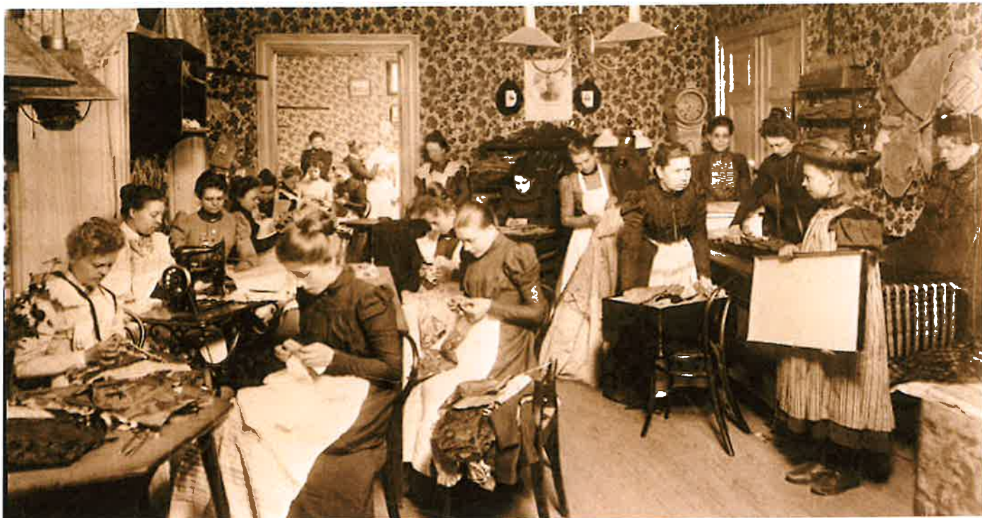
BILD 2: Augusta Lundins syateljé vid Brunkebergstorg i Stockholm omkring år 1900. På bilden syns sömmerskor, proverskor och tillskärerskor i fullt arbete. Företaget försåg hela Stockholms societeten, inklusive kungligheter, med det främsta i klädväg.