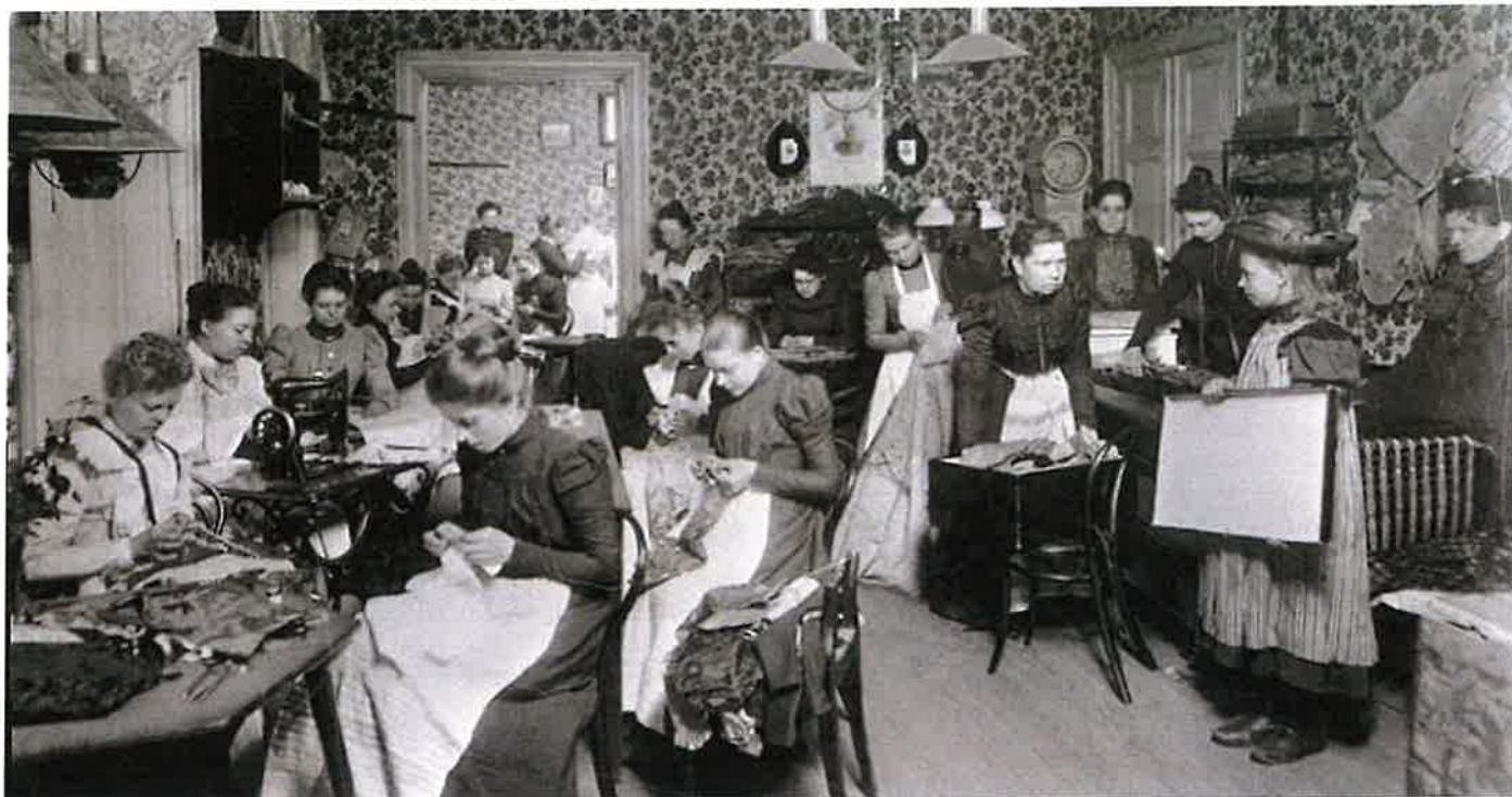
BILD 2: Augusta Lundins syateljé vid Brunkebergstorg i Stockholm omkring år 1900. På bilden syns sömmerskor, proverskor och tillskärerskor i fullt arbete. Företaget försåg hela Stockholms societeten, inklusive kungligheter, med det främsta i klädväg.