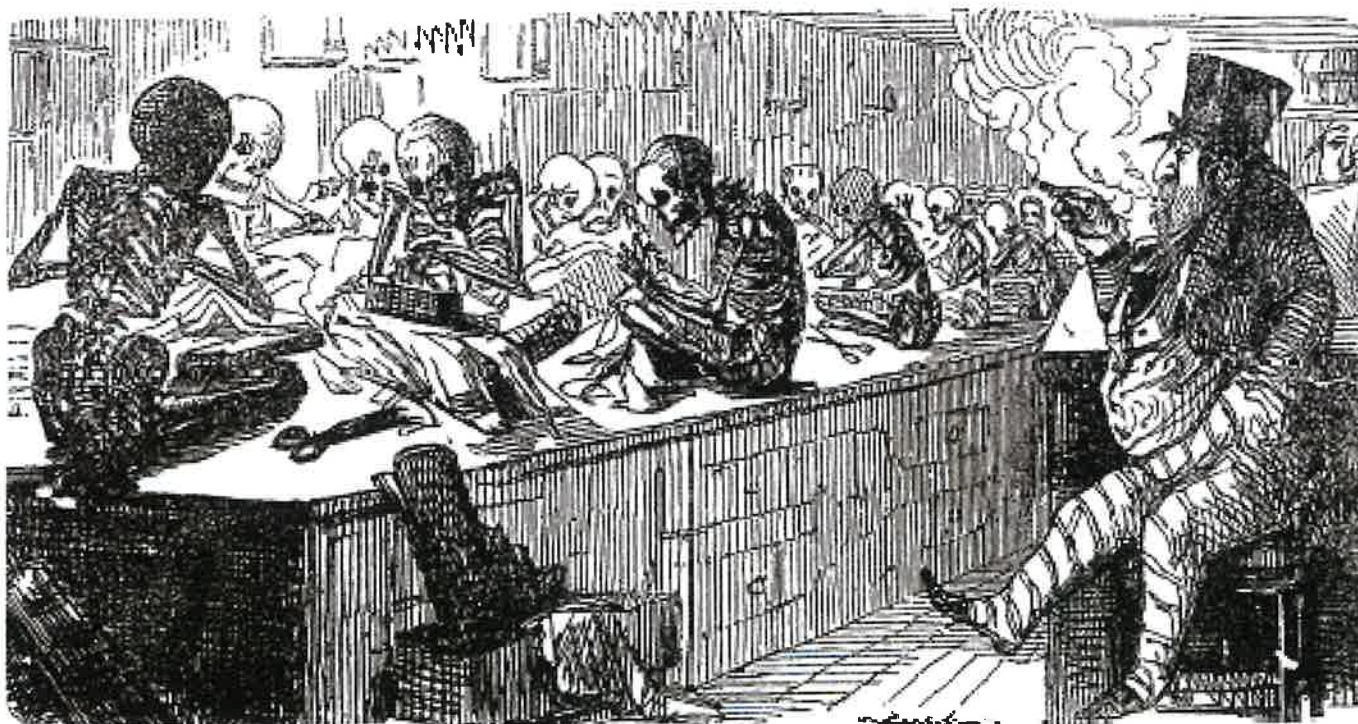
BILD 1: Denna karikatyr av tecknaren John Leech publicerades i Punch Magazine (en satirisk brittisk veckotidskrift) 1845. Bildtexten till denna karikatyr är: Billiga kläder.